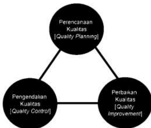
Gambar. Konsep Trilogi Juran

Sejalan dengan Deming, Joseph Juran memiliki keyakinan bahwa masalah kualitas dapat ditelusuri sampai pada keputusan-keputusan manajemen. Menurut Juran, 85% dari permasalahan-permasalahan kualitas/mutu organisasi disebabkan karena proses-proses yang dirancang dengan buruk. Oleh karena itu, perlu adanya perencanaan kualitas yang baik seperti disebut Juran sebagai Strategic Quality Management yaitu proses perbaikan kualitas. 11 Konsep Juran yang terkenal yaitu Trilogi Juran (1989) menyebutkan bahwa manajemen mutu terdiri dari tiga bagian pokok, yaitu: (a) perencanaan mutu, (b) pengendalian mutu, dan (c) peningkatan mutu. Sebagaimana ditunjukkan dalam gambar berikut.