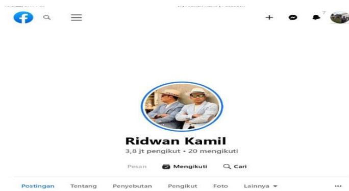
Gambar 2. Foto profil Akun facebook Ridwan Kamil